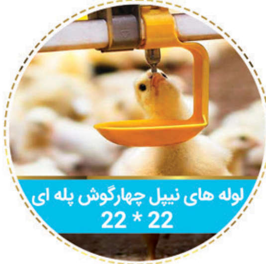
لوله های نیپل چهارگوش پله ای 22 * 22