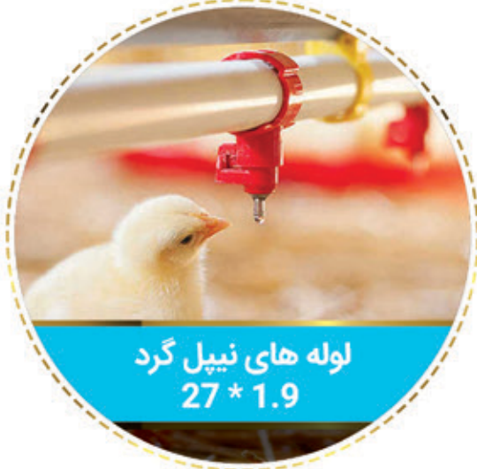
لوله های نیپل گرد 27 * 1.9